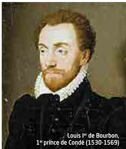
Louis I er de Bourbon, 1 er prince de Condé (1530-1569)

Manassés II succède à son père. Dans les premières années du 13 ème siècle, il s'allie à une formidable ligue, aux cotés du Roi d'Angleterre Jean sans terre , contre son