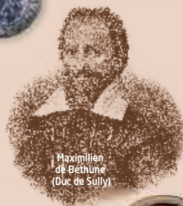
Maximilien de Béthune (Duc de Sully)