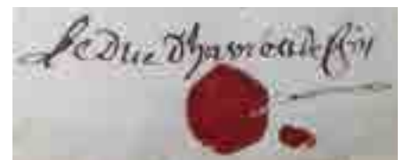
Sceau et signature Duc d'Havré et de Croÿ.

Le 30 mars 1789, le duc d'Havré est nommé député aux Etats Généraux et quand la République apparaît, il émigre à l'étranger. Le dernier seigneur de Conty meurt à quatre vingt quinze ans le 12 novembre 1839. Son fils, Maximilien , prince de Croÿ d'Havré, né le 20 janvier 1821, est reconnu comme héritier testamentaire par le dernier seigneur de Conty.