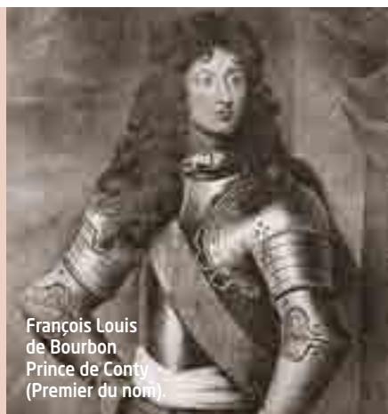
François Louis de Bourbon Prince de Conti (Premier du nom).