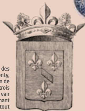
Blason des Princes de Conti, d'or au lion de gueules à trois bandes de vair brochant sur le tout