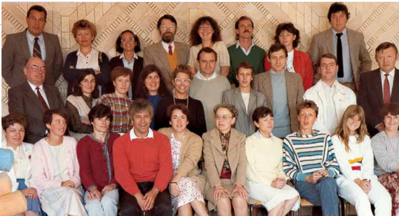
→ Professeurs en 1985/1986.