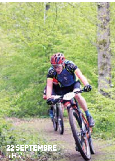
22 SEPTEMBRE 5 HVTT