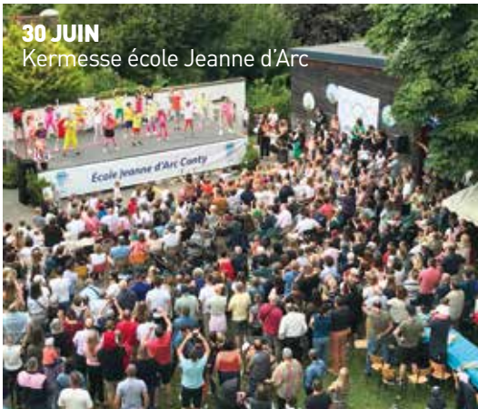
30 JUIN Kermesse école Jeanne d'Arc