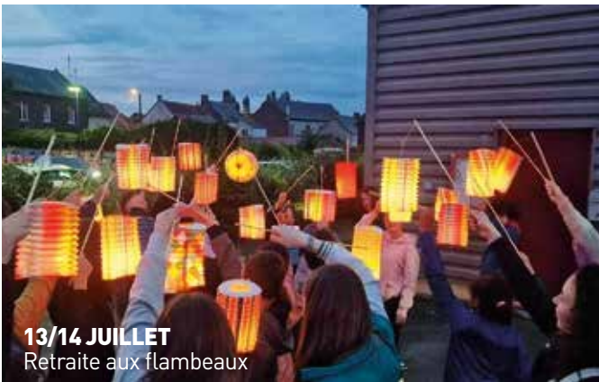
13/14 JUILLET Retraite aux flambeaux