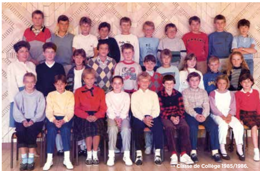
→ Classe de Collège 1985/1986.