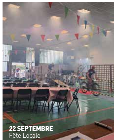
22 SEPTEMBRE Fête Locale