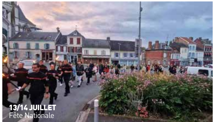
13/14 JUILLET Fête Nationale