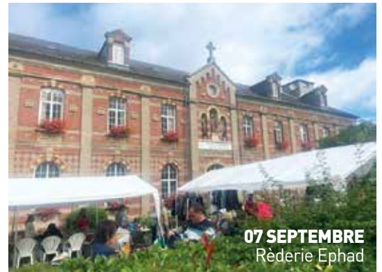
07 SEPTEMBRE Rèderie Ephad