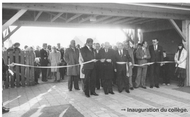
→ Inauguration du collège.

Autour du hall, 15 classes d'enseignement général, 2 classes de sciences, un atelier, une salle d'enseignement ménager, un CDI et un self-service pour accueillir les élèves du canton de Conty. Un délai très court et ambitieux : dix mois de construction réalisée par l'entreprise Setra et quelques sous-traitants, pour une rentrée prévue en septembre 1981. Coût de l'opération : 11 610 404 francs de l'époque supportés à 75% par le département, le reste étant couvert par le Syndicat scolaire (une belle opération pour l'État...) Le 10 septembre, ce sont 418 élèves et 37