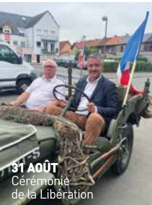
31 AOÛT Cérémonie de la Libération