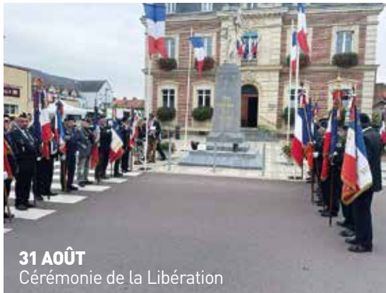
31 AOÛT Cérémonie de la Libération