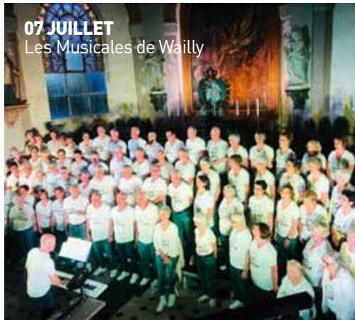
07 JUILLET Les Musicales de Wailly