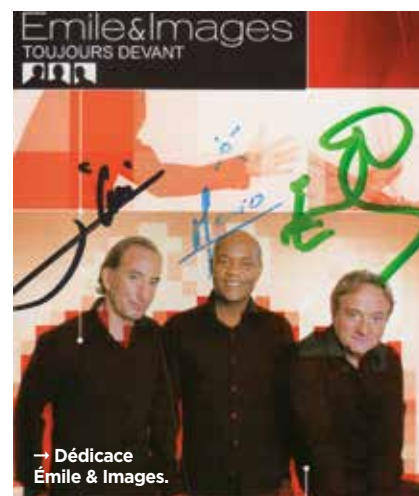
→ Dédicace Émile & Images.

moires. Vifs remerciements aux décideurs, aux organisateurs, au Comité d'organisation pour leur grand professionnalisme. Ils ont apporté d'inoubliables moments d'échanges et de partage à l'ensemble des personnes qui ont vécu ces journées de fête. ■■■