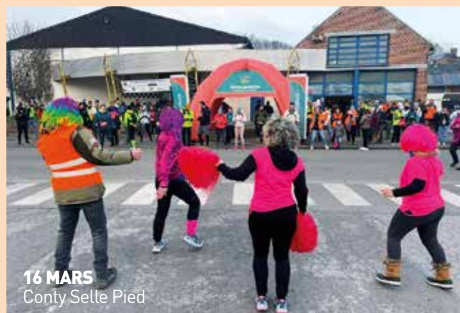
16 MARS Conty Selle Pied