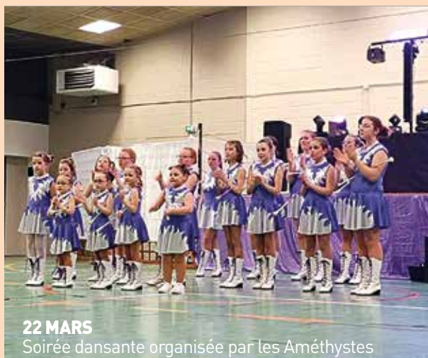
22 MARS Soirée dansante organisée par les Améthystes