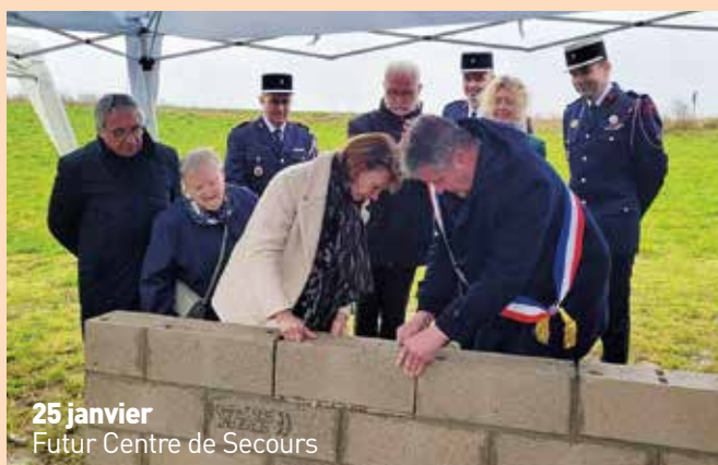
25 janvier Futur Centre de Secours