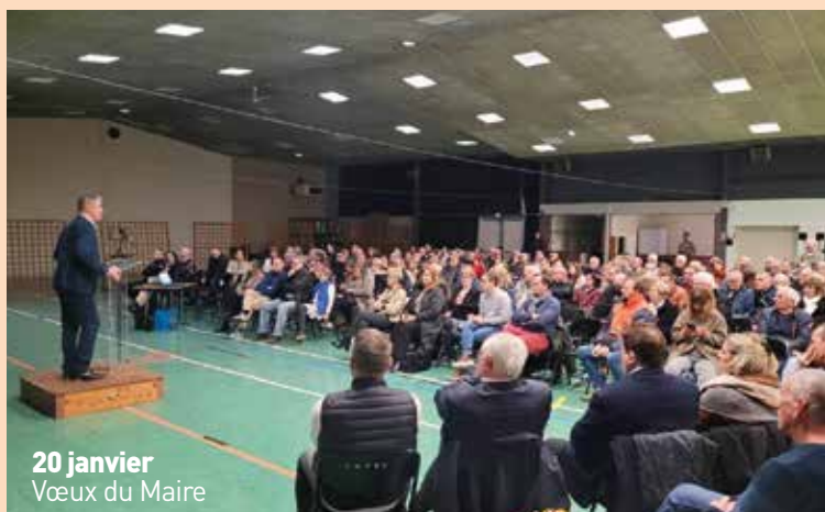
20 janvier Vœux du Maire