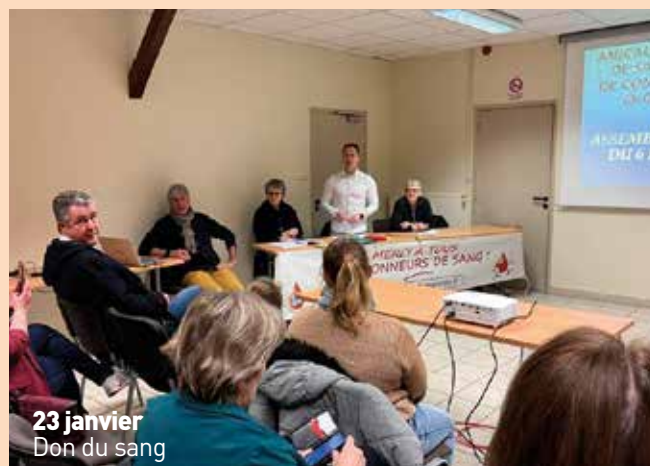
23 janvier Don du sang