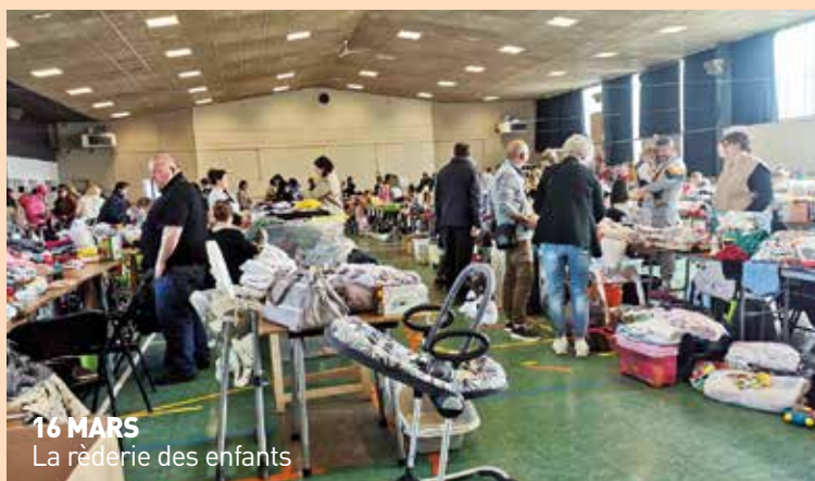
16 MARS La rèderie des enfants