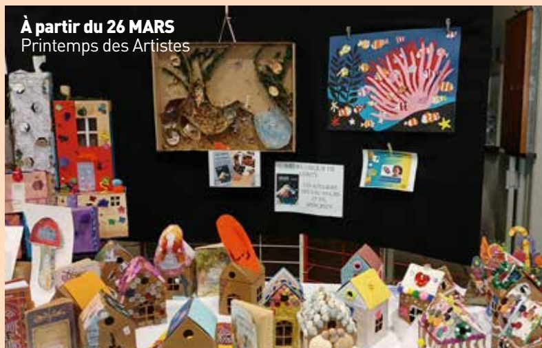
À partir du 26 MARS Printemps des Artistes