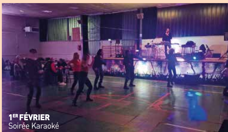
1 ER FÉVRIER Soirée Karoké